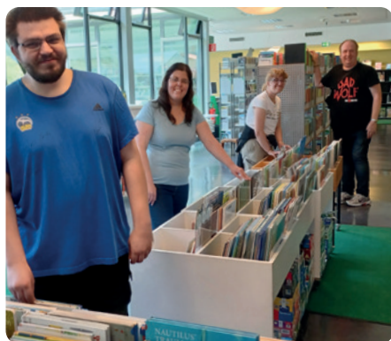
Mitarbeitende der BiG AGB in der Kinder-Bibliothek