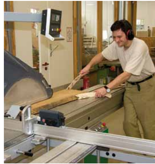
Aus dicken Eichenbohlen werden die Materialien zugeschnitten.