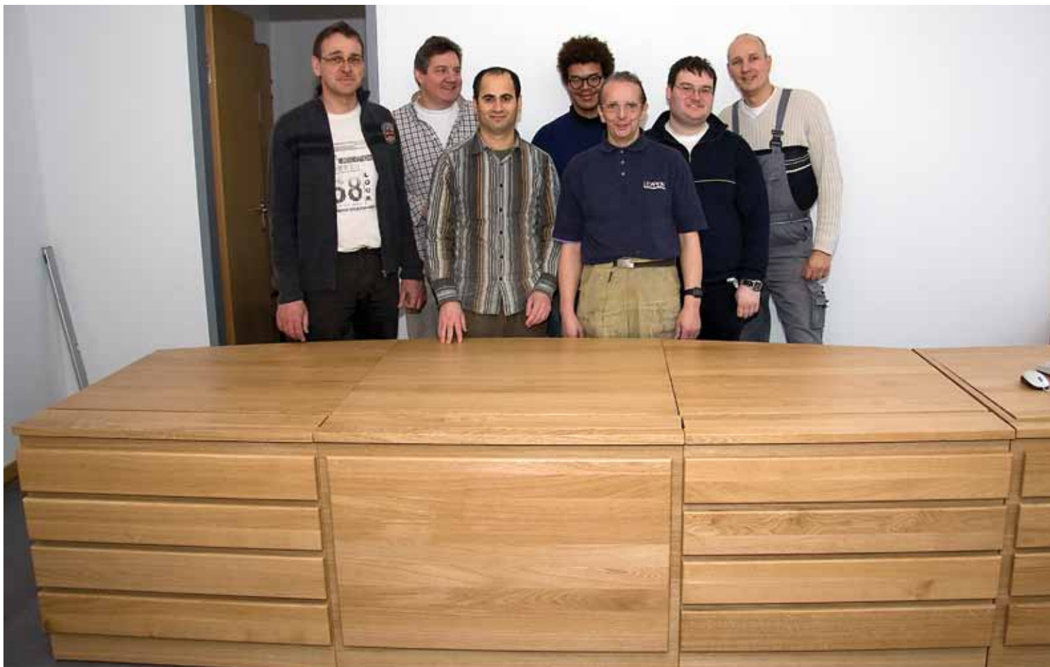
Zufriedener Kunde mit zufriedenen BWB-Mitarbeitern am Richtertisch.