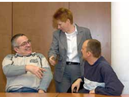
Herzlich begrüßt Bundestagsvizepräsidentin Petra Pau die Gäste aus der BWB-Ost.

Für die Werkstättenmitarbeiter aus der BWB war das ein interessanter Tag, der mit dem obligatorischen Rundgang durch die Kuppel endete. Er vermittelte einen guten Einblick in die Arbeitsweise des Parlaments. Das war Sozialkunde zum anfassen. Und die Vizepräsidentin des Bundestages demonstrierte anschaulich, dass sie vor allem die direkt gewählte Kandidatin ihres Wahlkreises Berlin-Hellersdorf ist, eine Politikerin, die man anfassen kann. ■