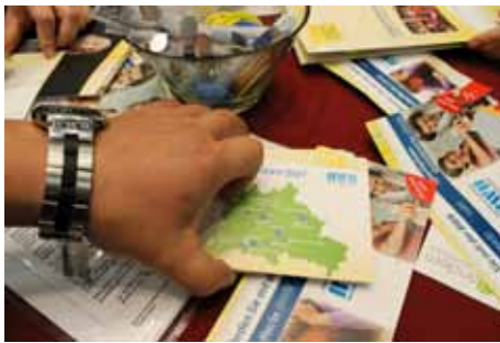
... über 600 Berufsbildkataloge gingen weg

Auch bei der BWB können sie sich zum Servicehelfer oder zum Großküchenhelfer quali-