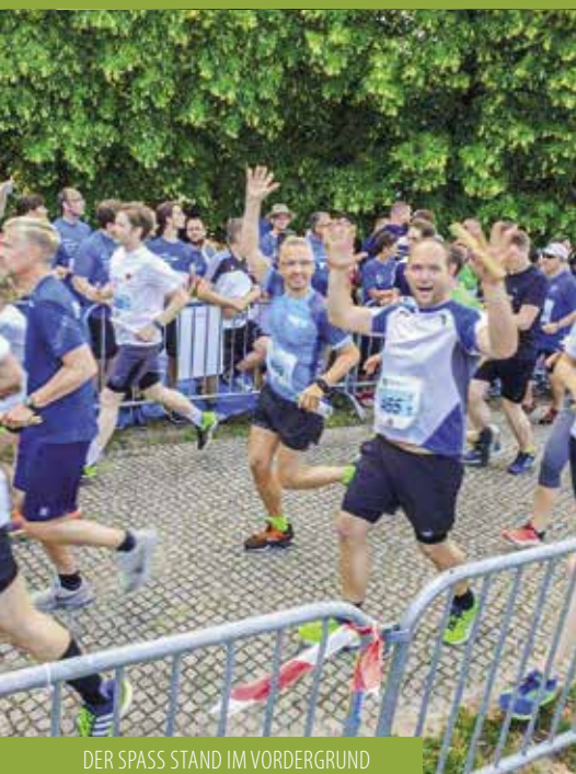
DER SPASS STAND IM VORDERGRUND