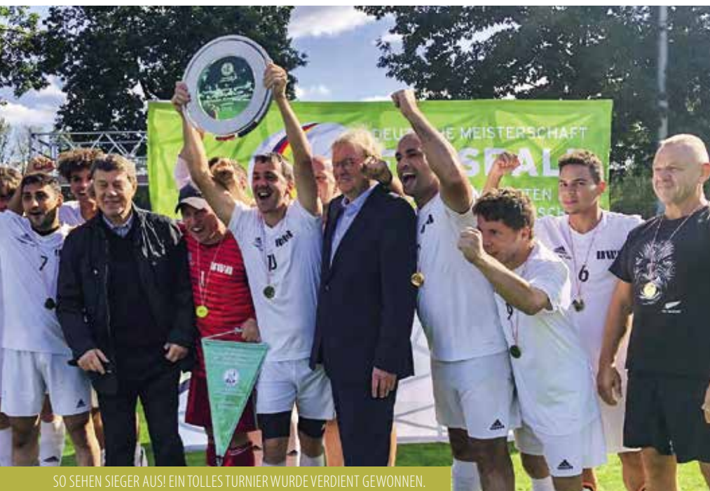
SO SEHEN SIEGER AUS! EIN TOLLES TURNIER WURDE VERDIENT GEWONNEN.

Das Männer-Fußballteam der BWB ist der neue Deutsche Meister der Werkstätten für behinderte Menschen. Auch bei anderen Turnieren punktet das BWB-Team regelmäßig.