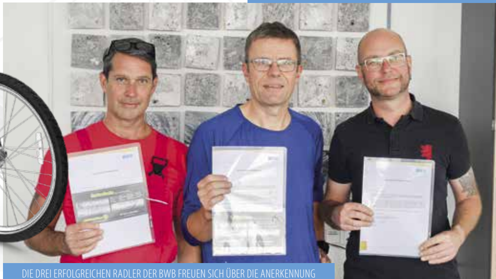
DIE DREI ERFOLGREICHEN RADLER DER BWB FREUEN SICH ÜBER DIE ANERKENNUNG