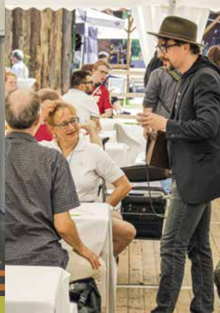
VIELE INTERESSIERTE BESTAUNTEN DIE NEUEN RÄUMLICHKEITEN