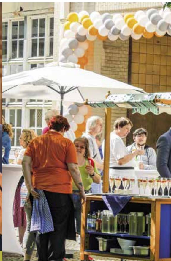
BERLINS SENATORIN FÜR INTEGRATION, ARBEIT UND SOZIALES ELKE BREITENBACH UND DIRK GERSTLE