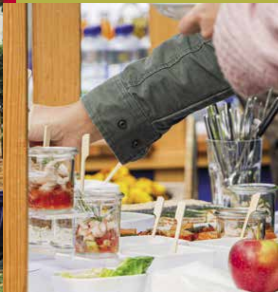
DIE KÜCHEN-CREW DER BWB VERWÖHNTE MIT LECKEREM FINGERFOOD