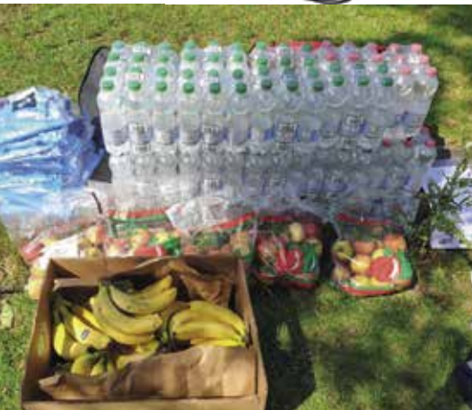
AUSREICHEND WASSER UND VITAMINE STANDEN BEREIT

Die zehn Teams der BWB konnte man an ihren hellblauen Lauf-Shirts erkennen und vom Streckenrand aus anfeuern. „Durchgeschwitzt und außer Puste, dabei aber zufrieden und glücklich kamen alle nach der Staffelstab-Übergabe zurück zum Treffpunkt, um mit Bananen, Äpfeln und Getränken die verlorenen Energien wieder aufzufüllen“, sagt Handschug. Die Resonanz aller BWB-Teilnehmer sei durchgehend positiv gewesen. „Deshalb werden wir uns im nächsten Jahr wieder anmelden – mit hoffentlich noch mehr aktiven BWB-Läufern.“