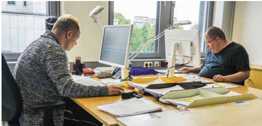
DIE MITARBEITER ARBEITEN IN DER BiG LAF SEHR AKRIBISCH UND GENAU

Aktuell besteht die BiG aus sieben Mitarbeitern. Sie bearbeiten und vervollständigen Unterlagen von Geflüchteten und archivieren die vollständigen Akten anschließend. Manchmal fehlen Papiere, es gibt Zahlendreher beim Geburtsdatum oder ein Name ist falsch geschrieben. All das recherchieren die BiGler selbstständig am Computer mit einem speziellen Programm, korrigieren und ergänzen, was nötig ist. „Die Mitarbeiter müssen ganz akribisch arbeiten, gut lesen und leserlich schreiben können“, sagt Löffler.