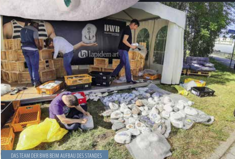
DAS TEAM DER BWB BEIM AUFBAU DES STANDES