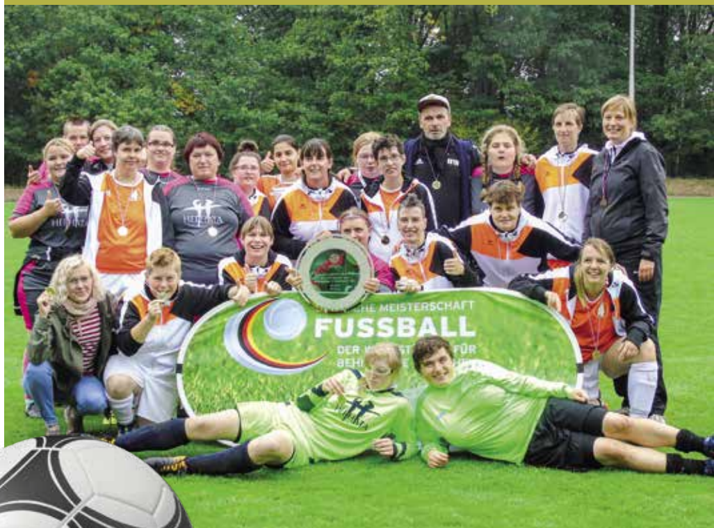
BEIDE FINAL-TEAMS AUF EINEM FOTO – TOLLE STIMMUNG UND GLÜCKLICHE GESICHTER