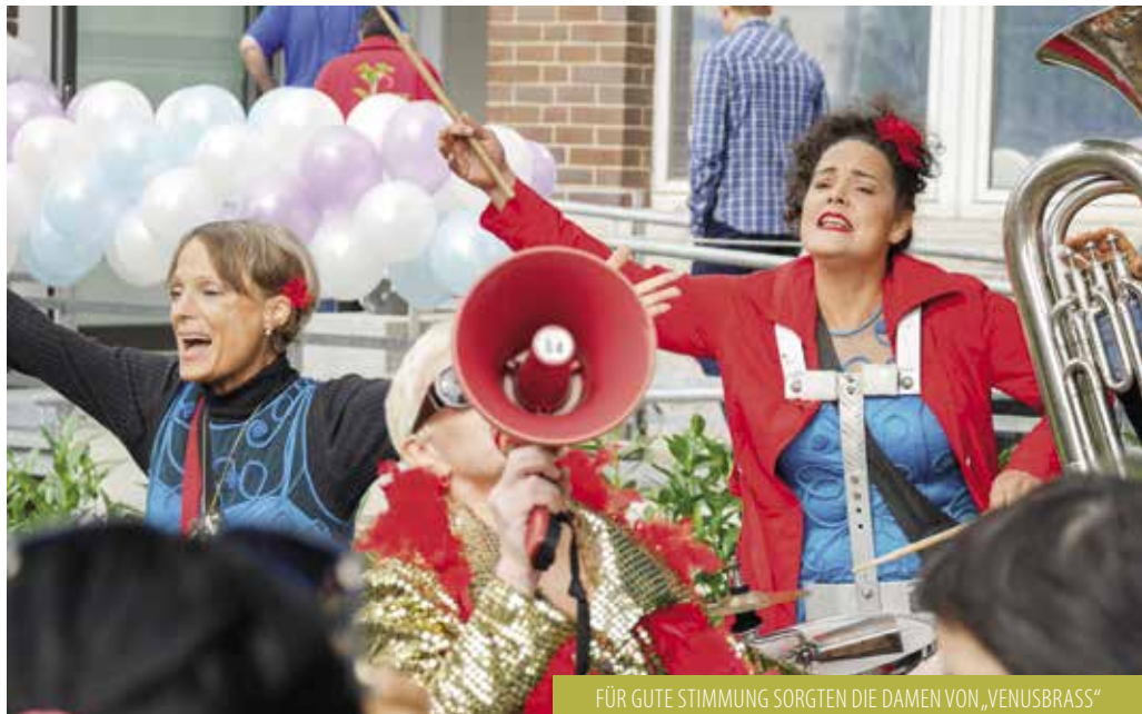
FÜR GUTE STIMMUNG SORGTEN DIE DAMEN VON „VENUSBRASS“

Nach den Reden wird bei Buffet und Live-Musik der Band „Venusbrass“ gefeiert und getanzt. Eine Polonaise führt die Besucher durch den Garten und in die neuen Räume.