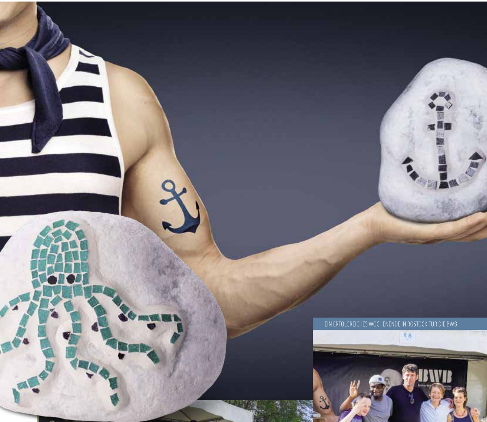
EIN ERFOLGREICHES WOCHENENDE IN ROSTOCK FÜR DIE BWB